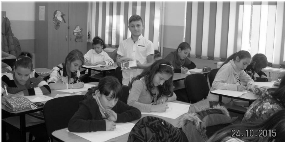
Clasa a V-a

La finalul concursului, clasamentul concursului de creație literară se prezintă conform tabelor alăturate.